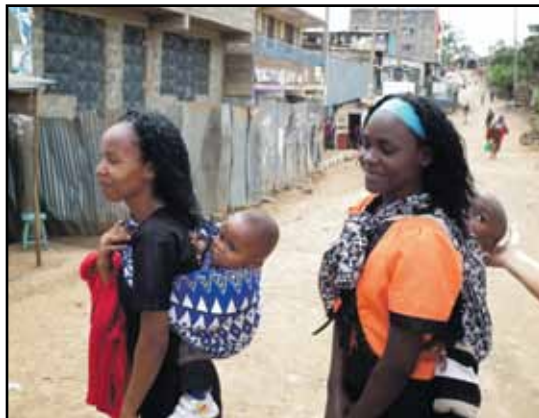
Tillitsfulle: Trygghet og smil - i fattige omgivelser.