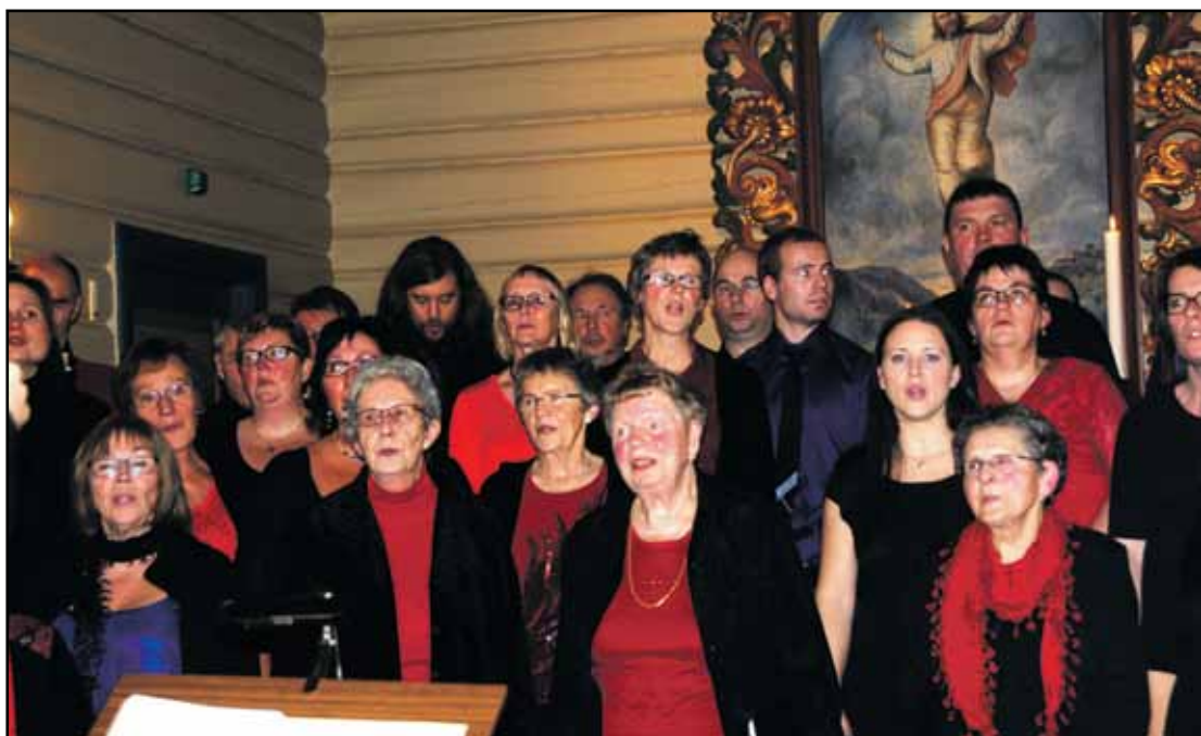
Deilig er jorden: Medlemmer av Rett og Slett og Ekko/Heimklang i Dalen kyrkje under innsyn- ging av jula 21. desember.