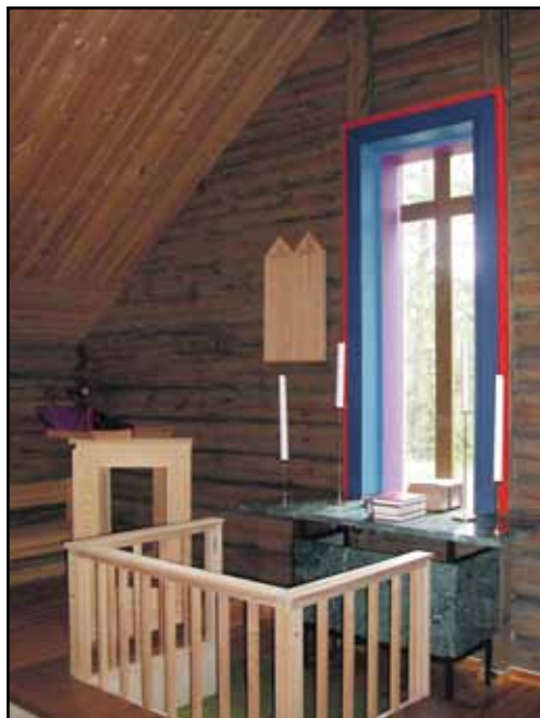
Fra alterpartiet i Egnund kapell.