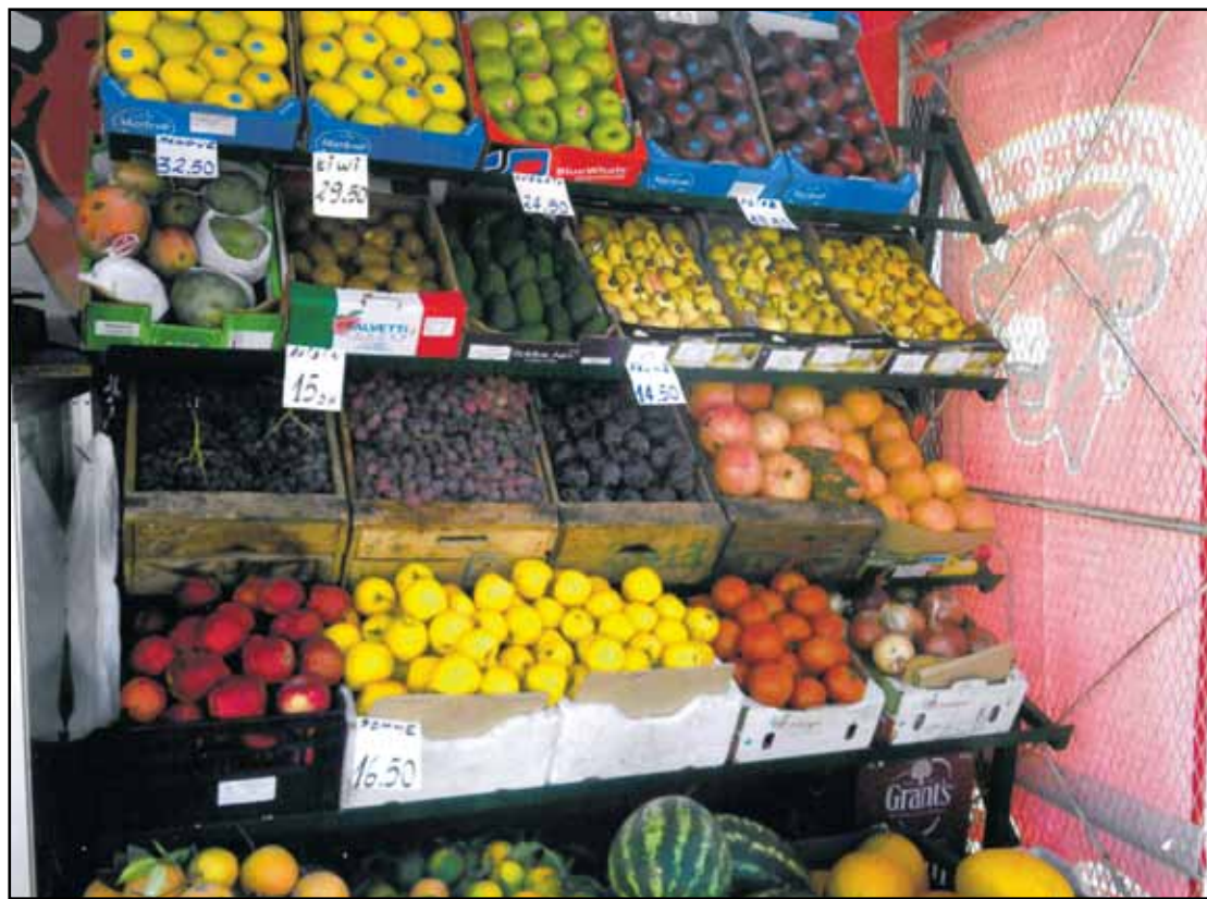
Fargerikt: Mye godt i frukt og grønnsaker.

sjukehus. «Det var veldig stussleg», sa ein mann som overlevde til oss. «Alt kom så brått på». Dei har bygd opp att det meste av byen, men held enno på med det.