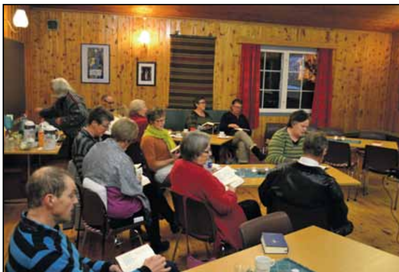
Syng med: Utsnitt av den syngende forsamling.