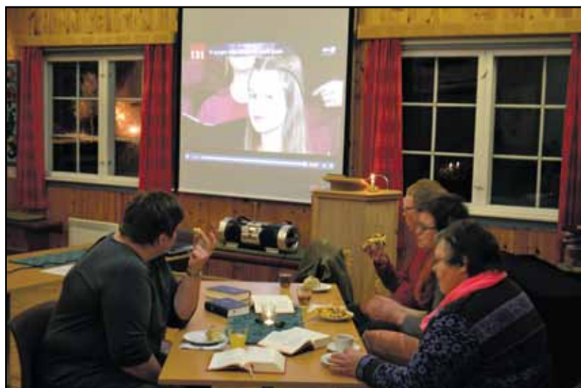
Sang og servering: Under salmekvelden var det pizza, kaffe og brus.