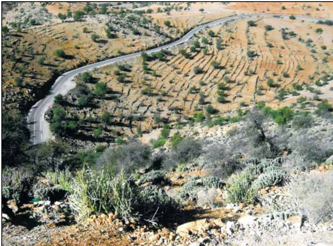
Grønt innimellom: Ørkenlandskap mellom Agadir og Atlasfjella.

Men eit blidt og venleg folkeslag, og pene ungar, som leika seg med ball og trebilar. Her var det ikkje luksus. Dei vanlege kleda om dagen var fotside stakkar, bode for kvinner og menn. Dei fleste damene bar hijab som hovudplagg.