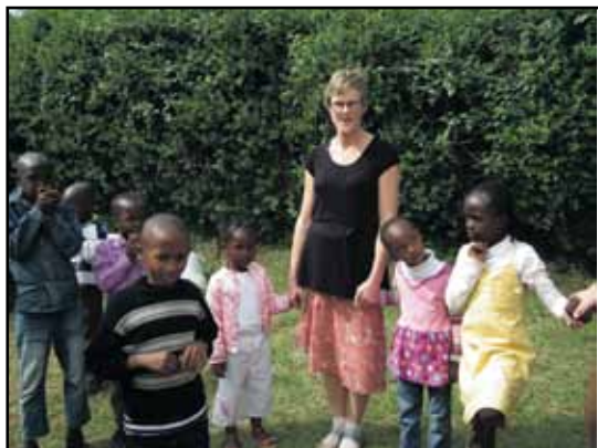
Framtidshåp. Barna hadde ikke noe imot å bli fotografert sammen med besøket fra Folldal.

det noe "klamt" å måtte være avhengig av vertskapet for i det hele tatt å kunne bevege seg utendørs. Da var det å gå i flokk, slik at alle ble med og ingen ble overlatt til seg selv. Ikke alle steder var like godt egnet for den som var hvit. Dette var lett å forstå da fattigdommen var stor og befant seg rett utenfor hotellet vårt. Derfor var det ikke bare greit å overlate veskene med de viktigste papirene og verdisakene til kvinnene som etter god skikk skulle bære bagasjen for gjestene. Det at det kom ukjente kvinner og overtok håndveskene, var en ren tillitsutfordring! Men det fungerte, og ingenting kom på avveie.