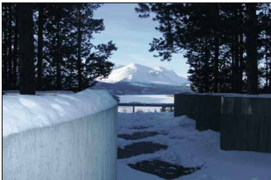
Rondane i blått og hvitt.