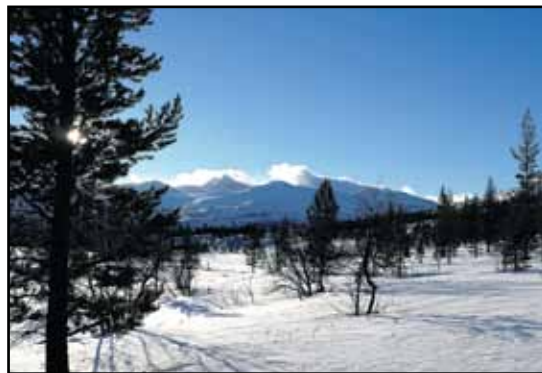
Mot Høgronden

Etterjulsvinteren er ofte en stille og rolig tid. Det er enda mye mat i fryseren og det er ganske rent over alt. Dette er en tid for å kose seg og å ta det litt roligere. Jeg husker fra barndommen at dette var tida for å drive ute hvis det ikke var sprengkaldt. Vi lagde slalåmbakker og spretthopp på de fleste jorder. Det var nesten ikke tid til å gå inn og spise. En morgen jeg som vanlig var på vei ut, ble jeg stoppet av en av mine onkler som bodde på garden. Han lurte på om jeg vil være med ei ku som hete Lena til oxen. Lena var yndlingskua mi, ei stor, rød kolle og verdens snilleste, så det ville jeg selvfølgelig. Jeg var 7 – 8 år og syntes det var stas og bli spurt om å få være med på et slikt oppdrag. Vi skulle til ei tante og en onkel som hadde gard ca. 3 kilometer lenger nord i bygda. De hadde en staselig okse. Så onkelen min la grime på kua og jeg skulle danne baktrøpp. Det var mildvær og fint føre men ganske bratt oppover. Det gikk ikke så fort med oss men vi kom fram til kaffe og kaker. Så fikk Lena møte «oksen i sitt liv» og alt var såre vel.