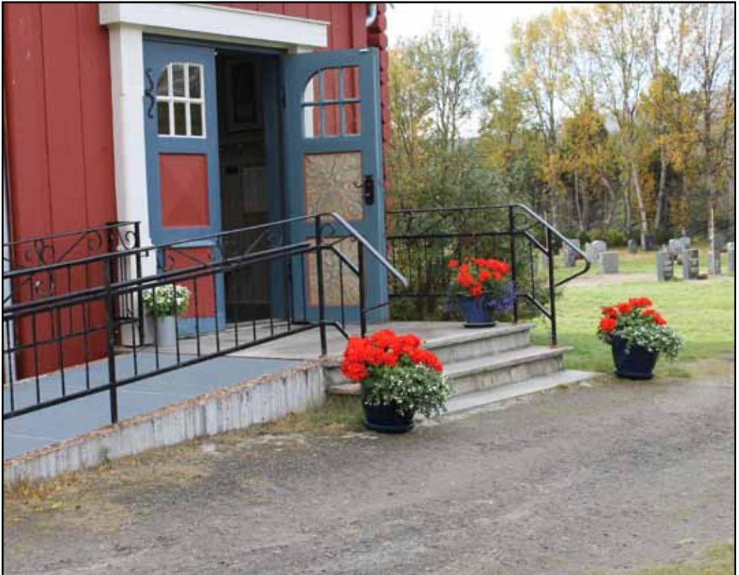
Dalen kyrkje pynta til hausttakkefest